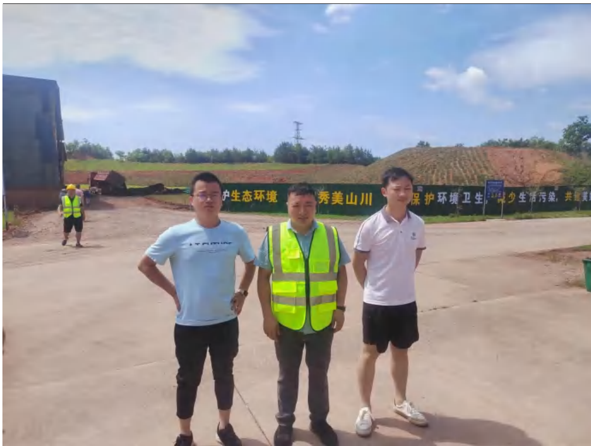
评价人员现场合影