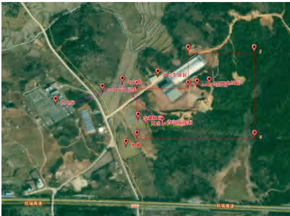
图 2-2：周边环境示意图

除上述外，采场周边 300m 范围内无医院、学校、大型水库及相邻矿山，500m 范围内无高压电线，1000m 可视范围内无铁路、国道等重要建筑及公共设施。