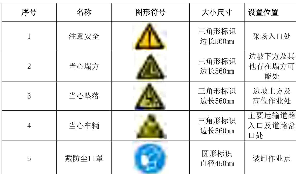
表 3-8 矿山安全标志表